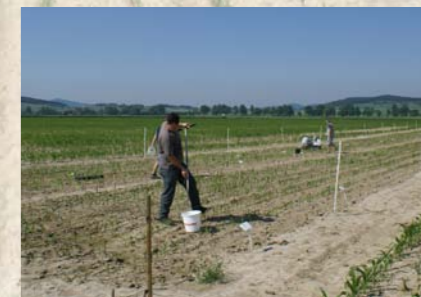
Zakładanie doświadczenia polowego (z lewej) i pierwsze próbobranie (z prawej) w Braszowicach