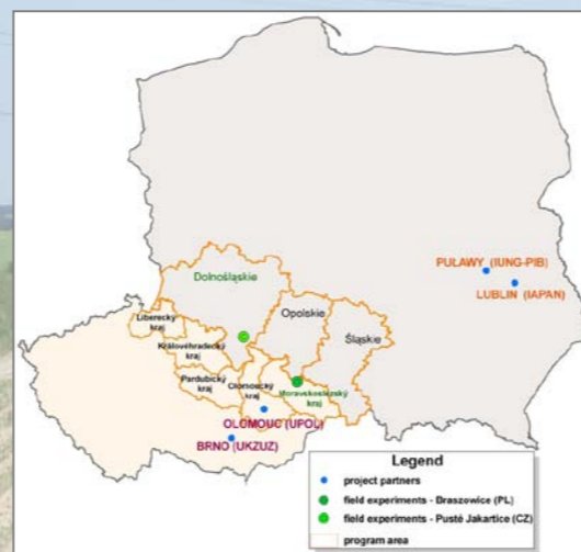
Lokalizacja partnerów projektu oraz doświadczeń polowych